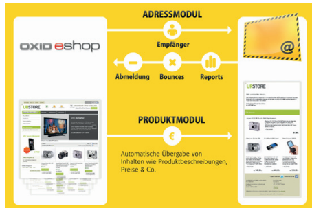
Typischer Datenfluss für eine Integration zwischen einem Online-Shop und einer E-Mail Marketing Lösung wie Inxmail Professional

Aus dem Shop werden dabei Empfängerdaten über ein Adressmodul und Inhalte wie Produktinformationen und Preise an die E-Mail Marketing Lösung übergeben. Dort können dann schnell und effizient Newsletter erstellt werden.